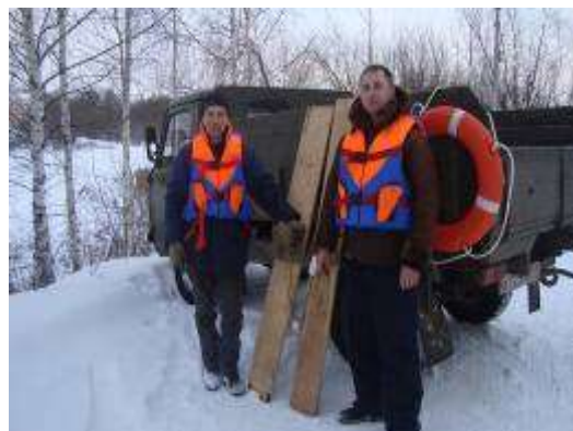
Спасательные средства, применяемые зимой