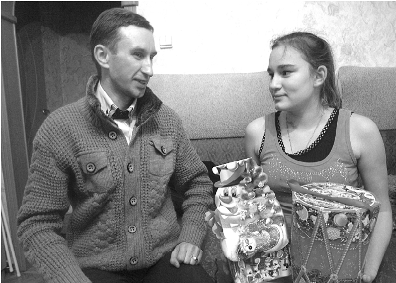
Фото и текст Оксаны ГАМОВОЙ

Пятерых ребятишек ждал ещё один новогодний добрый привет – от воспитанников областного реабилитационного центра для детей и подростков с ограниченными возможностями, передавших для краснозоренских сверстников самого младшего возраста свои поздравления и подарки.